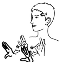
Niets is er