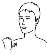
met sterkt , omgordt * met heerlijkheid