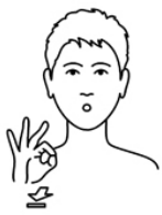
dat schoon ***