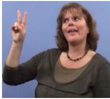
De Heer '