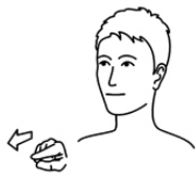
hij, die in der